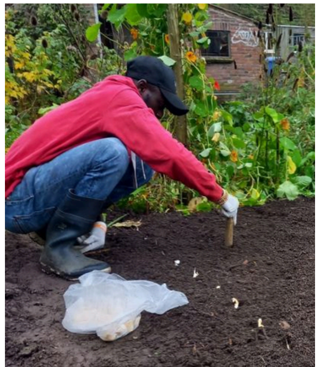
ZAADJES PLANTEN IN DE GASTTUIN

Zo vertelt ze dat ze zelf 70 is en dat haar partner waar ze een lat relatie mee heeft en haar vrienden een vergelijkbare leeftijd hebben. “Ik zou natuurlijk ook hen in mijn testament kunnen zetten, maar wat moeten ze tegen die tijd nog met mijn nalatenschap? En misschien zijn ze er dan zelf niet meer. Ik geef mijn leeftijdsgenoten liever nu iets als ze dat nodig hebben en verdeel mijn erfenis over goede doelen.”